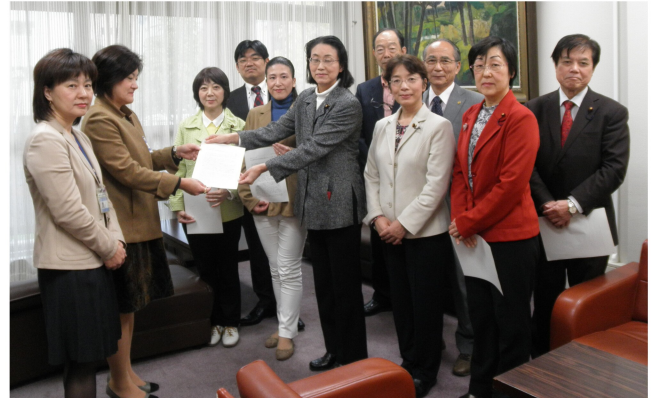
池戸女性活躍・男女共同参画担当理事(左から2人目)に申し入書を手渡す日本共産党横浜市議団=11月20日、横浜市役所

申し入れでは、男女間賃金格差の是正の取り組みを重点施策として明確に位置づけ、具体的な事業を定めること、保育所・学童保育・高齢者福祉の充実、中学校給食の実施、小児医療無